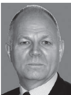
Freiburghaus Piéric PSVS